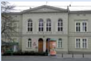
Przedstawicielstwo w Bydgoszczy

W wyniku reformy administracyjnej od dnia 1 stycznia 1999 r. z połączenia większości obszarów dawnych województw: bydgoskiego, włocławskiego i toruńskiego zostało utworzone Województwo Kujawsko-Pomorskie. Administracja samorządu województwa mieści się w Urzędzie Marszałkowskim Województwa Kujawsko-Pomorskiego w Toruniu . Urząd zapewnia wykonywanie ustawowych zadań przez Zarząd Województwa, pełną obsługę (kadrową, prawną, organizacyjną i ekspercką) organów zarządu województwa, marszałka województwa oraz sejmiku województwa. W celu udogodnienia mieszkańcom województwa kontaktu z administracją samorządu województwa powołano do życia przedstawicielstwa jako zamiejscowe komórki organizacyjne Urzędu Marszałkowskiego. Przedstawicielstwa urzędu znajdują się w Bydgoszczy (ul. Jagiellońska 9, tel. 52 327 68 84, fax. 52 321 33 42), Włocławku (ul. Bechiego 2, tel. 54 235 67 10, fax. 54 235 67 11), Inowrocławiu (ul. Roosevelta 36/38, tel. 52 355 91 95, fax. 52 355 95 24) i Grudziądzu (ul. Sienkiewicza 22, tel. 56 462 45 15, fax. 56 462 24 22).