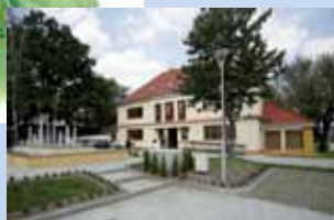
Przedstawicielstwo we Włocławku