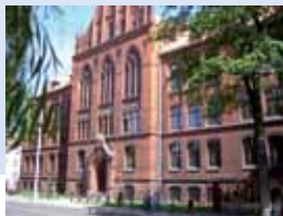
Przedstawicielstwo w Grudziądzu