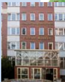
Przedstawicielstwo w Inowrocławiu